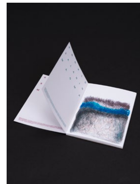
Publication MAGMA, regroupant 12 cartes postales avec les œuvres de Ronald Saladin, réalisée en collaboration avec BSB Kreativwerkstatt, Bürgerspital Basel, et ultra:éditions