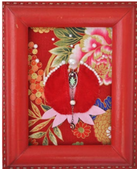
Sabrina Renlund, « La Gaichatte », 2022, média mixte, 18 x 24 cm © Sabrina Renlund – Atelier Arts-média-design, Fondation Clair Bois

Organisée avec les Ateliers Arts, médias, design de la Fondation Clair Bois, l'exposition de Sabrina Renlund présentait de nombreuses œuvres réalisées avec différents matériaux : textiles, céramique, perles et objets chinés. Dans la plaquette réalisée par ASA-Handicap mental à cette occasion, le texte de la chanson « Libre » écrit par l'artiste donnait le ton de l'exposition :